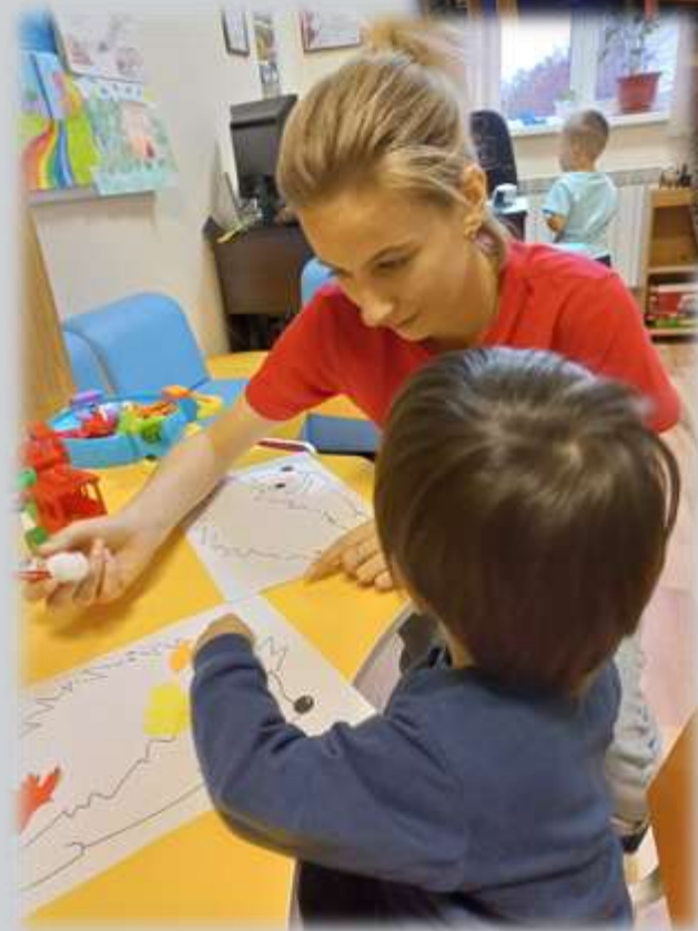
Семья и забота